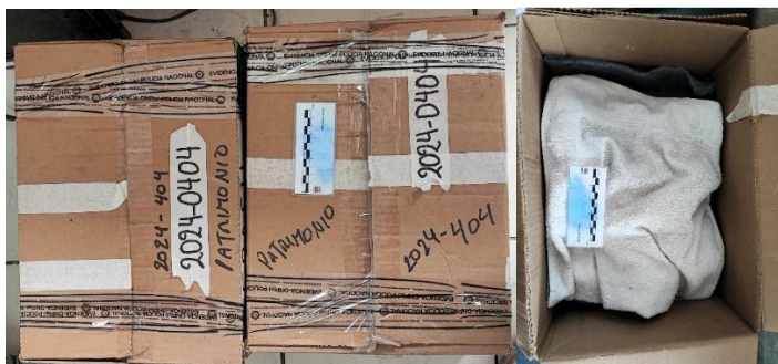
Imagen 1. Embalaje de evidencias del caso.

Para dar cumplimiento a esta disposición, el día día de la revisión se revisó cantidad de objetos en números y letras del caso en mención, en el lugar donde se realizó la revisión , como consta en las siguientes fotografías: