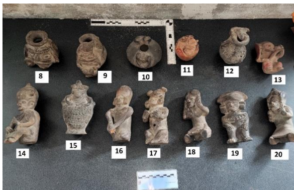
Imagen 2. Revisión de los objetos de este caso en lugar donde se realizó la revisión .